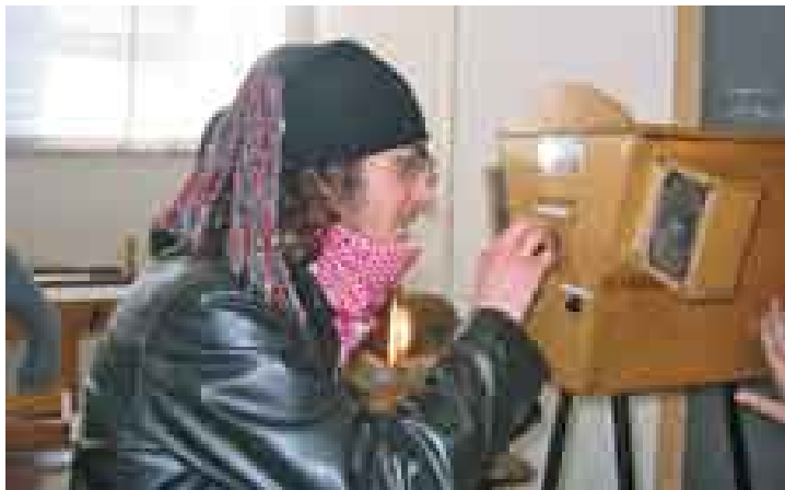
Un appassionato di musica prova il suo "orecchio" con l'exhibit Note a memoria .

Il successo ottenuto da questa impostazione museologica pose il problema di come fare per replicare gli exhibit che venivano richiesti da altri musei. La soluzione fu quella di privilegiare la divulgazione del sapere alle royalties e al copyright, pubblicando dei veri e propri "ricettari" (cookbooks) che, descrivendo i materiali e le tecniche costruttive utilizzate,