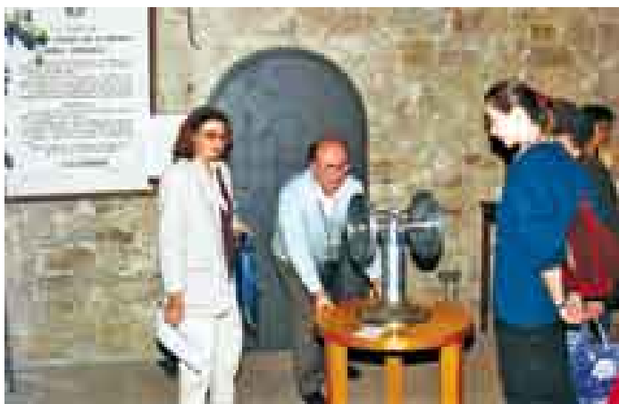
Perugia, ottobre 1995. Congresso della Società Italiana della Fisica. Allestimento della mostra "Le Ruote Quadrate" nella Rocca Paolina.