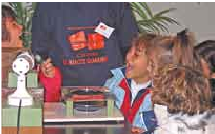
Gli exhibit parlano il linguaggio di chi li usa. La gioia dei bambini alle prese con l'exhibit: le parabole.

Le iniziative sopra elencate hanno avvicinato ai temi della Scienza decine di migliaia di persone su tutto il territorio nazionale, facendoli partecipare all’esplorazione e alla scoperta dei fenomeni della natura. Sono stati coinvolti decine di Enti Pubblici, Istituzioni Scolastiche o Soggetti Privati e sono state attivate sinergie con Enti aventi gli stessi scopi, sia a livello nazionale che europeo.