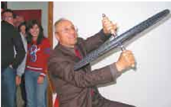
Evoluzioni con l'exhibit Ruota di bicicletta giroscopica.

Una nuova sfida, creare un Science Center , fece spostare l'obiettivo bruscamente verso Calitri. Il problema era però quello di avere uno spazio di esposizione stabile e mezzi finanziari adeguati. La sfida fu parzialmente vinta grazie a due fattori decisivi, entrambi dovuti al vantaggio di vivere in un piccolo paese: la possibilità di finanziare la costruzione