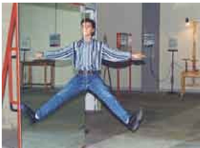
Exhibit: specchio antigravità . La simmetria di una immagine speculare e la simmetria del corpo umano creano l'impressione del volo.